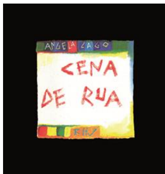
Figura 2 – Capa do livro Cena de Rua , de Ângela Lago (1994)

O livro Cena de Rua (Figura 2), de Ângela Lago (1994), também foi foco de estudo do quinto encontro do curso, realizado no dia 25 de setembro de 2014. O livro foi premiado como melhor livro de imagem pela FNLIJ no ano de 1995 e faz parte do acervo do PNBE para os Anos Iniciais do Ensino Fundamental (2005). Antes mesmo da leitura integral do livro, os professores foram convidados a pensar em uma cena que envolvesse um menino e a rua à noite, e transpusessem sua ideia para uma folha de papel preta, utilizando somente as cores vermelho, verde e amarelo, as mesmas usadas na narrativa (Figura 3). Depois de socializar todas as imagens produzidas pelos professores, com o ambiente totalmente escuro, a narrativa foi apresentada em no programa PowerPoint.