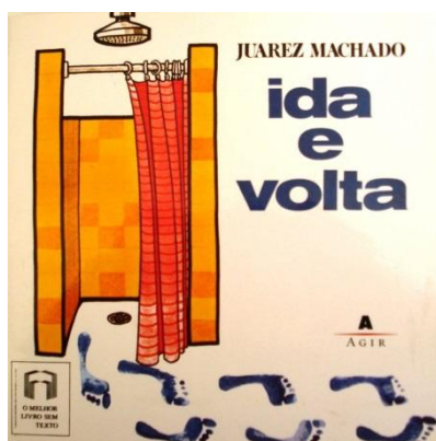
Figura1 – Capa do livro Ida e Volta , de Juarez Machado (2001)

Iniciemos pela apresentação do segundo encontro, realizado no dia 2 de setembro de 2014, com a presença de 35 professores. Para isso, tomamos o livro Ida e Volta , de Juarez Machado (2001). Entre os motivos para a sua seleção está a sua relação fundante com este gênero no país, pois, ao ser publicado em 1976, tornou-se o primeiro livro de imagem publicado no Brasil (Figura 1). Vale também destacar que o título faz parte do acervo do PNBE para a Educação infantil (anos 2008 e 2014) e foi premiado pela FNLIJ como melhor livro de imagem em 1982.